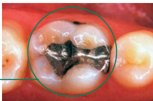
Füllung eines Zahnes mittels Amalgam