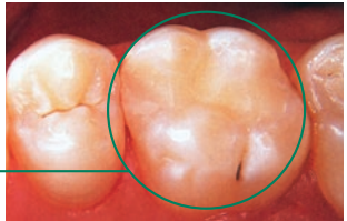
Füllung eines Zahnes mittels Komposit