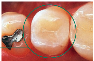
Füllung eines Zahnes mittels Keramik-Inlay